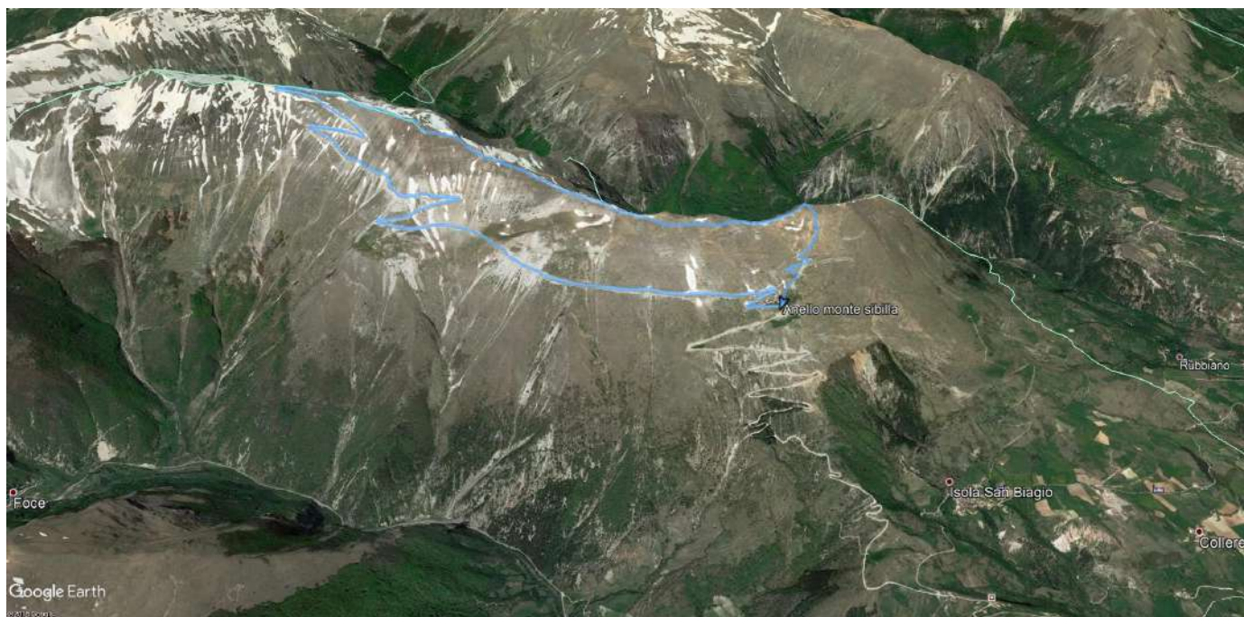
Traccia del percorso su Google Earth

L'attività escursionistica è un'attività che presenta dei rischi e chi la pratica se ne assume la piena responsabilità; le Scuole e le Commissioni del CAI adottano tutte le misure precauzionali affinché nei vari ambienti si operi con il maggior grado di sicurezza possibile, ma comunque il rischio è sempre presente e mai azzerabile.