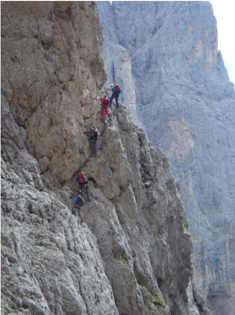
Un passaggio sulla via ferrata del Porton