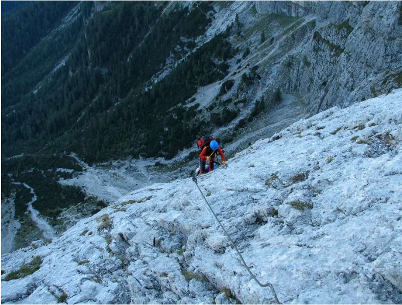
Un passaggio sulla via ferrata del Velo

Programma annuale sezione S. BENEDETTO DEL TRONTO