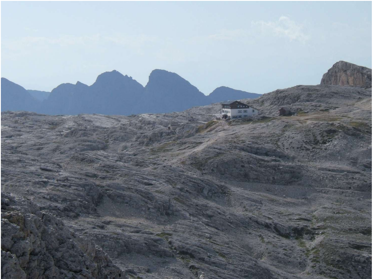
Il Rifugio Rosetta e l'altopiano delle Pale

Programma annuale sezione S. BENEDETTO DEL TRONTO