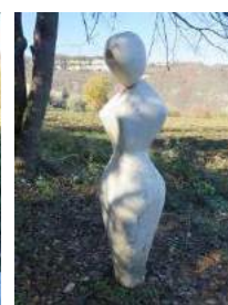
Trame di travertino

Per ulteriori informazioni e per effettuare prenotazioni potete rivolgervi presso la sede del CAI ogni mercoledì e venerdì dalle ore 19 alle 20, telefonare allo stesso orario allo 0736 45158 oppure consultare il nostro sito www.caiascoli.it