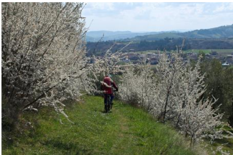
Sulla dorsale di confine tra Marche e Abruzzo