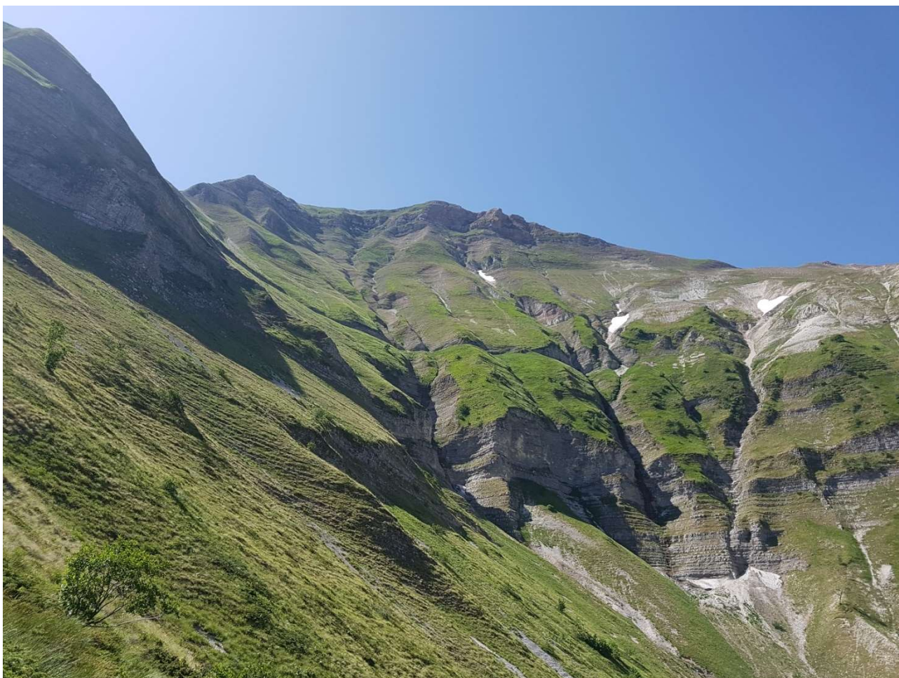
Uno scorcio del versante nord della Sibilla

L'attività escursionistica è un'attività che presenta dei rischi e chi la pratica se ne assume la piena responsabilità. Le Scuole e le Commissioni del CAI adottano tutte le misure precauzionali affinché nei vari ambienti si operi con il maggior grado di sicurezza possibile, ma comunque il rischio è sempre presente e mai azzerabile.