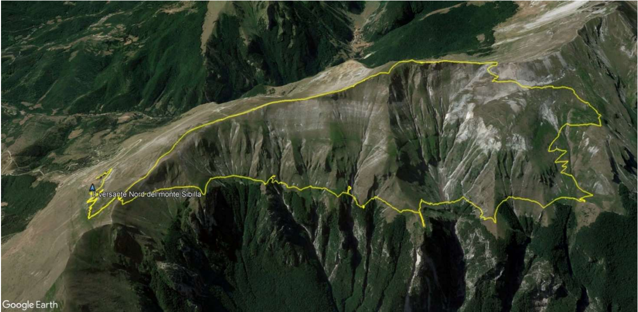
Il percorso su Google Earth visto da Nord

Programma annuale Sezione SAN BENEDETTO DEL TRONTO