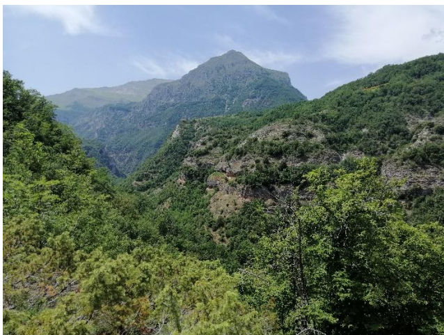
Monte Priora e il Pizzo dal GAS

Il sentiero che parte da Vetice attraversa un fitto bosco di lecci "lecceta della Samara" e prati scoscesi da cui affiorano pareti rocciose crivellate di anfratti. Questo sentiero è solo un tratto di un'antica via di montagna che collegava l'Adriatico a Roma. La vecchia strada saliva da Vetice, per attraversare il fosso del Rio, e riscendere all'eremo di San Leonardo in Volubrio.