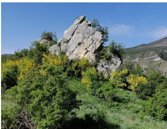
Sella erbosa da cui si intraprende l'esile traccia che traversa il pendio sopra al fosso del Rio