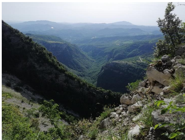
Cengia stretta all'uscita dalla lecceta della Samara